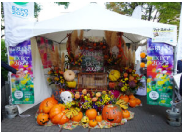
横浜市などによる国際園芸博PRフォトスポットもハロウィン装飾