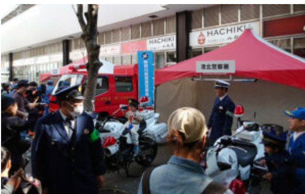
港北警察署の白バイは今年も人気