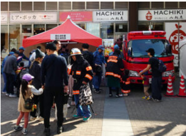
港北消防署と港北消防団は今年も共同でブース出店